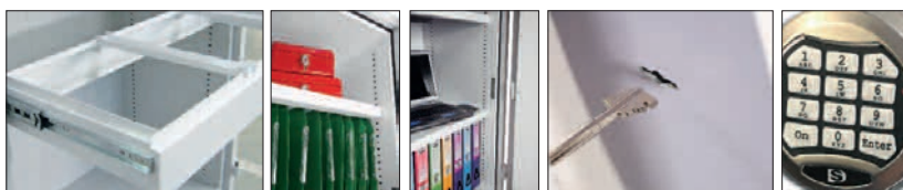
Ausziehrahmen für Hängeregister optional