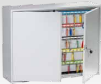
Abb.: SC 600