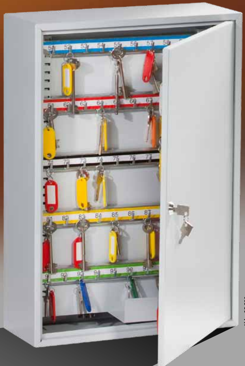
Abb.: SC 200

Nummerierte Schlüsselleiste, in der Höhe verstellbar Korpus verzinkt und pulverbeschichtet