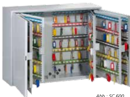
Abb.: SC 600