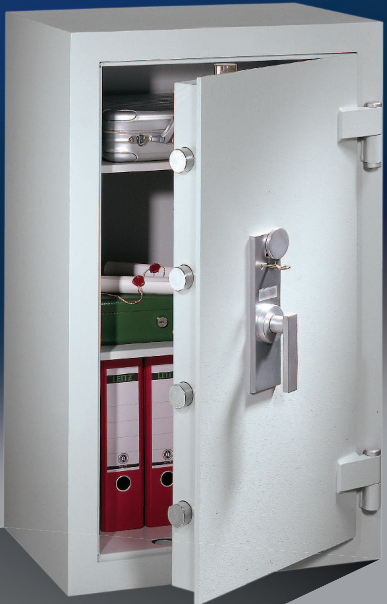
Abb.: GT 100

Fachböden ordnertief; rundum doppelwandig, starke Bolzen