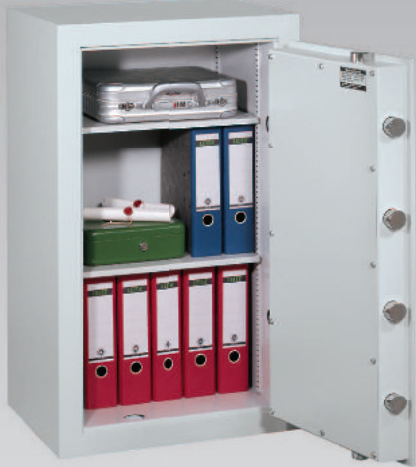
Abb.: GT 100 S