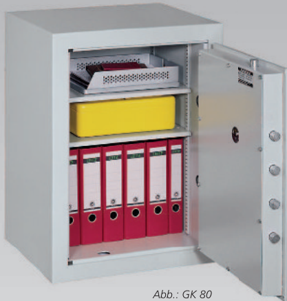
Abb.: GK 80