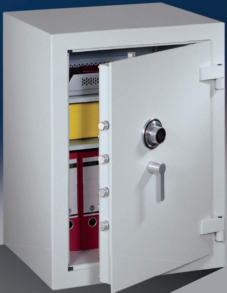
Abb.: GK 80 (mit Sonderausstattung ZKS)

Fachböden ordnertief; rundum doppelwandig