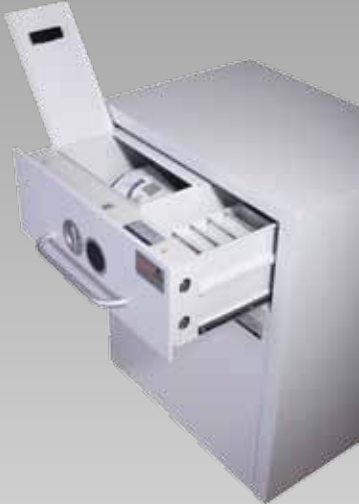
Abb.: MVS (mit Option – Inneneinrichtung in Schublade)