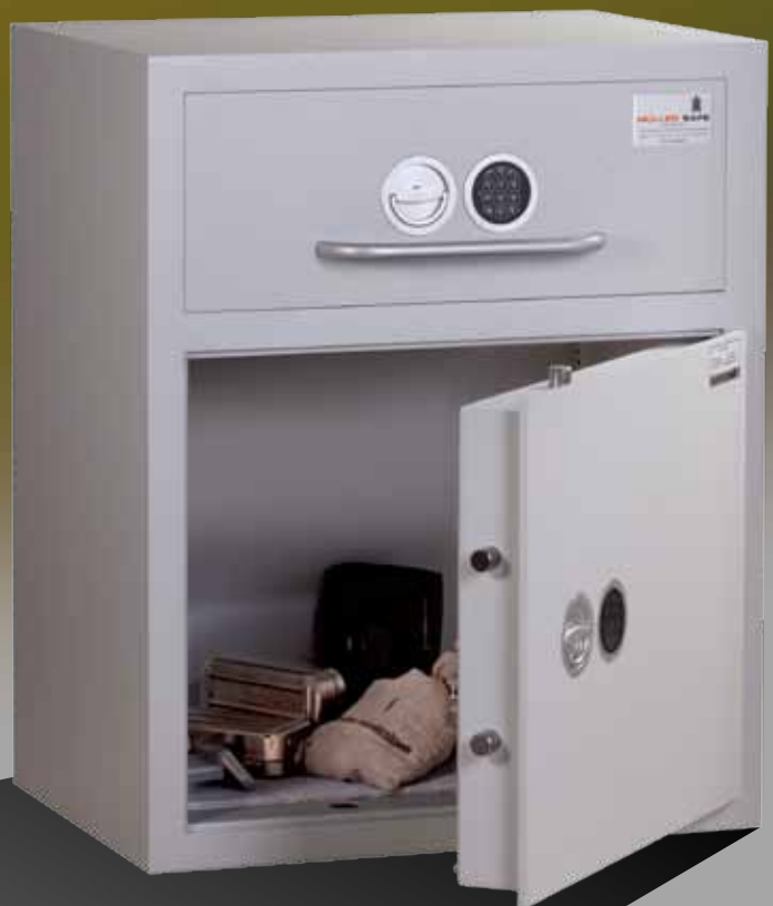
Abb.: MVS (mit Sonderausstattung Elektronikschlüssel)