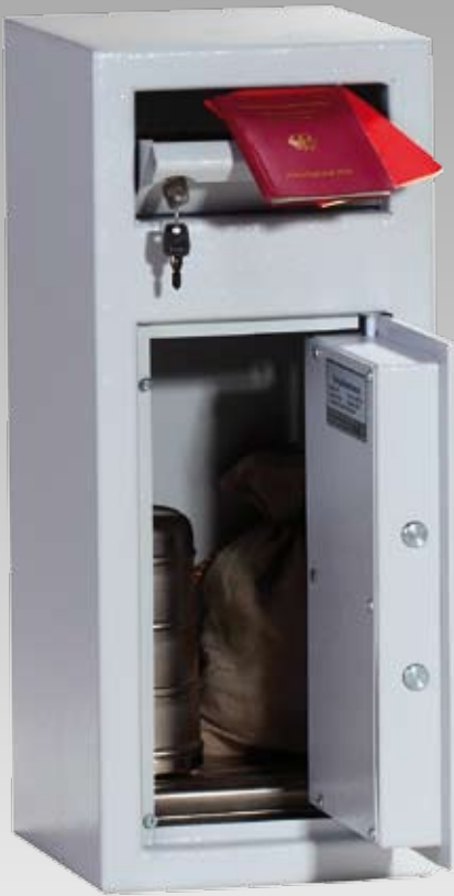
Abb.: MPT 1