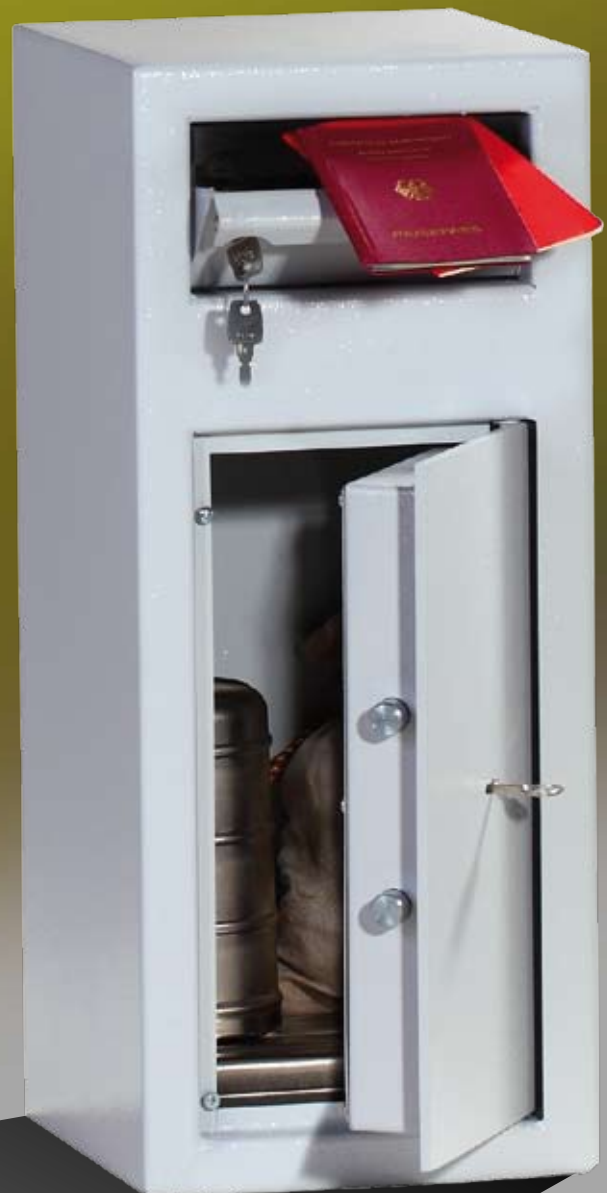
Abb.: MPT 1

verschiebbare Einwurflappe mit Rückholsicherung