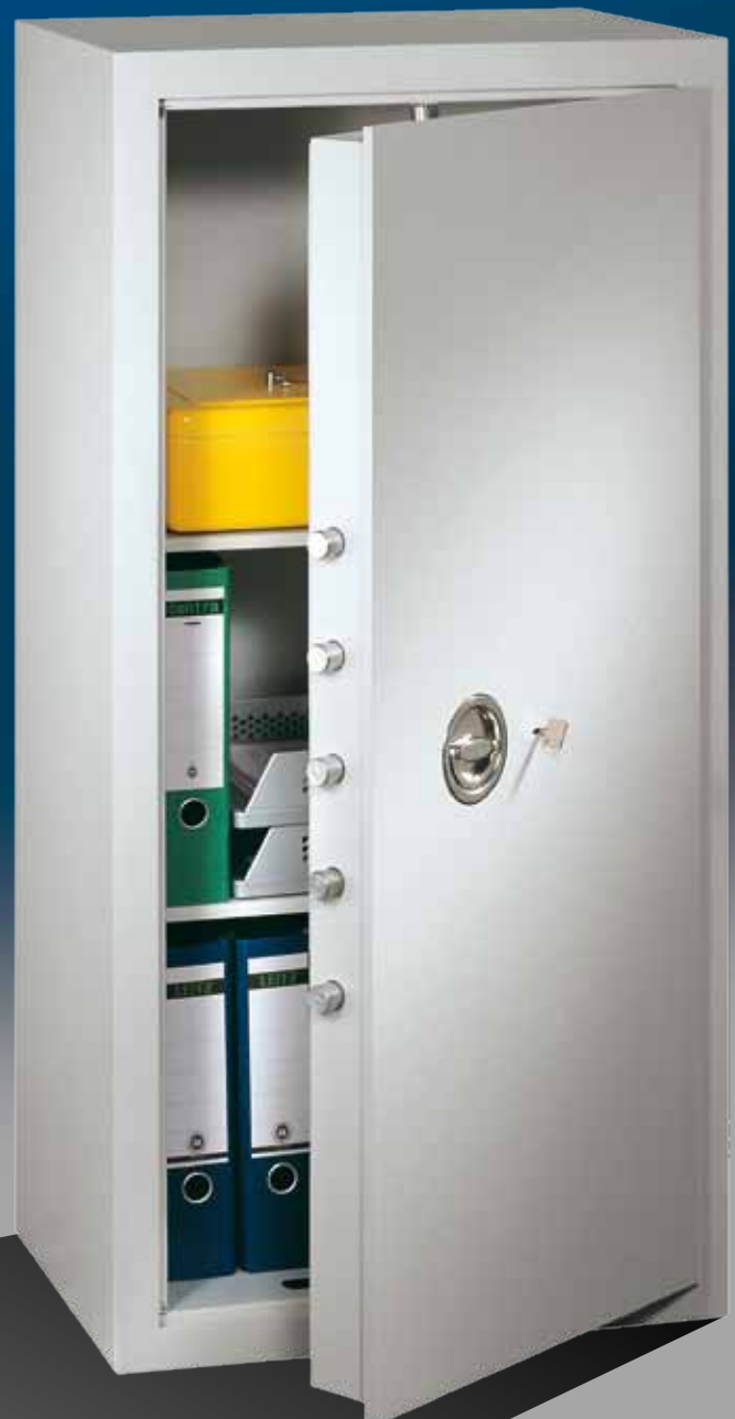
Abb.: MVO 12