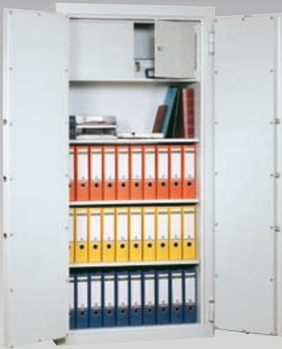
Abb.: DK 195/3 (mit Sonderausstattung Innentresor)