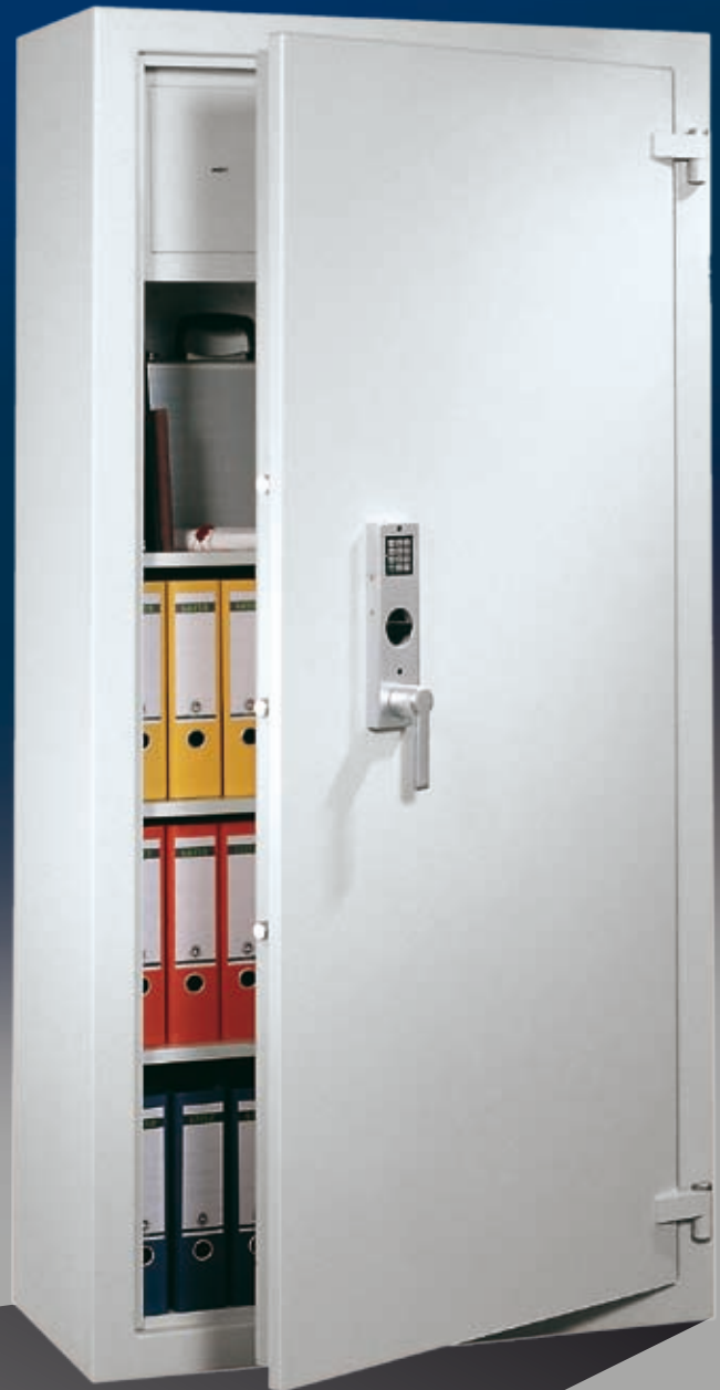
Abb.: DK 195/2 (mit Sonderausstattung EZ und Innentresor)