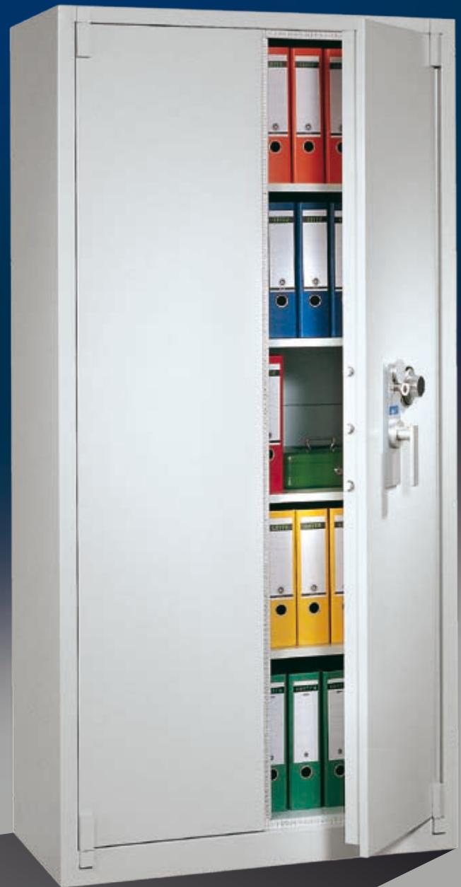
Abb.: BS 1100 (mit Sonderausstattung zusätzlichem ZKS)

Tür dreiwandig; Stahlschrank über alle Kanten gebogen und sorgfältig verschweißt