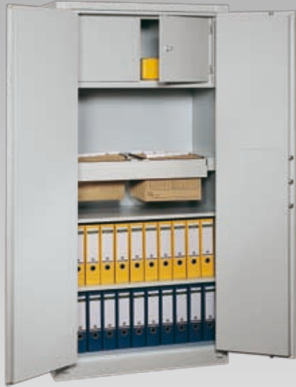
Abb.: BS 1100 (mit Sonderausstattung Innentresor und Teleskopauszug)