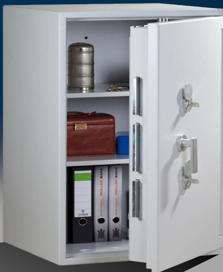
Abb.: EW 4-105