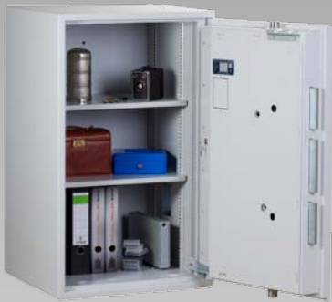
Abb.: EW 4-105