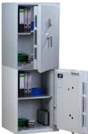
Abb.: EW 3T-163

Auf Anfrage: Zertifizierte Ausführung mit zwei Türen übereinander (Muster siehe unten)