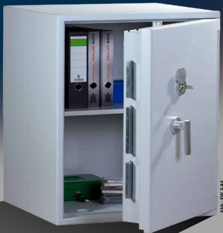
Abb.: EW 3-84