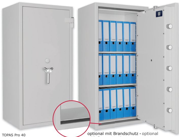
TOPAS Pro 40 Lichtgrau • light grey optional mit Brandschutz • optional with fire protection

Dekoration nicht im Lieferumfang enthalten • decoration not included in the delivery