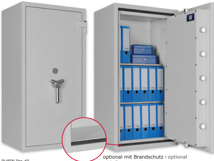
RUBIN Pro 40 Lichtgrau • light grey optional mit Brandschutz • optional with fire protection Dekoration nicht im Lieferumfang enthalten • decoration not included in the delivery