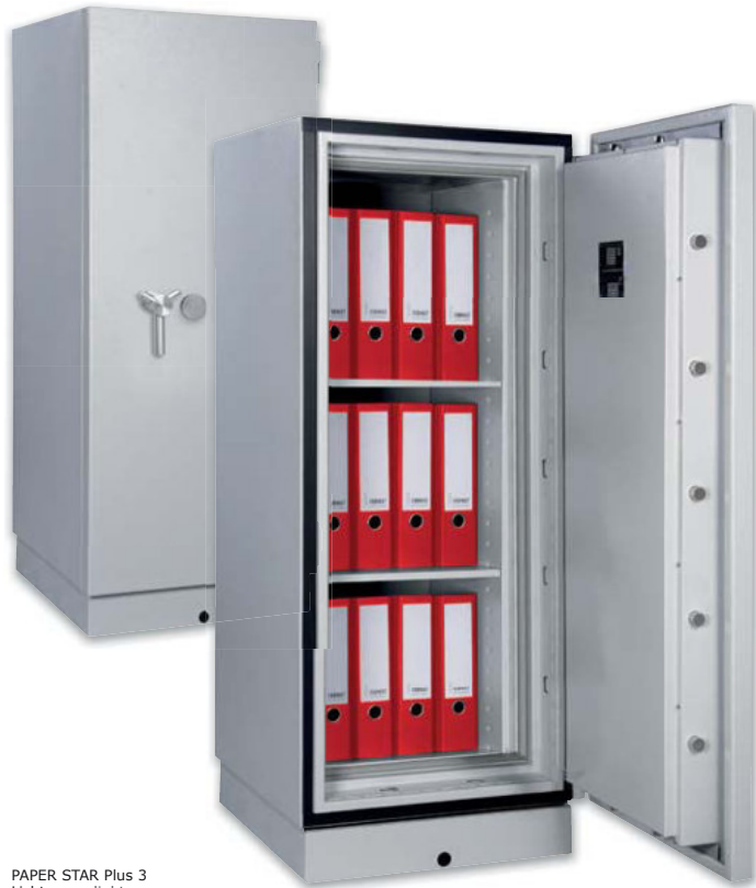
PAPER STAR Plus 3 Lichtgrau • light grey

Papiersicherungsschrank, S120P (EN 1047-1) / Grad I (EN 1143-1) Document protection safe, S120P (EN 1047-1) / Grade I (EN 1143-1)