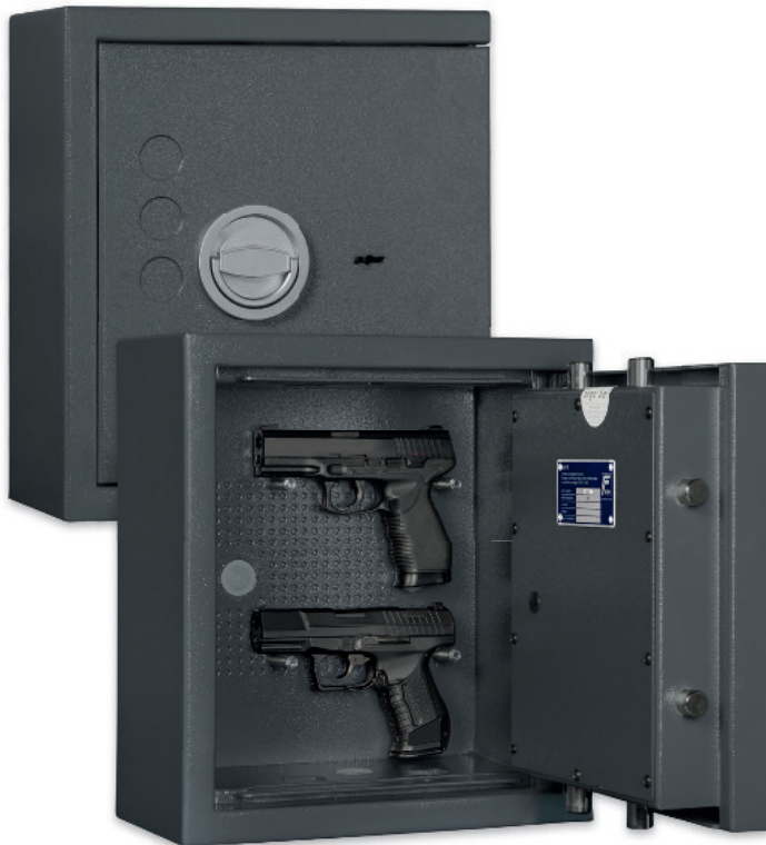
KWT 900 Graphitgrau • graphite grey Dekoration nicht im Lieferumfang enthalten • decoration not included in the delivery