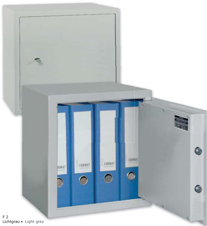
F 2 Lichtgrau • Light grey

■ Individuelle Anforderungen gegen Aufpreis möglich - sprechen Sie uns an!