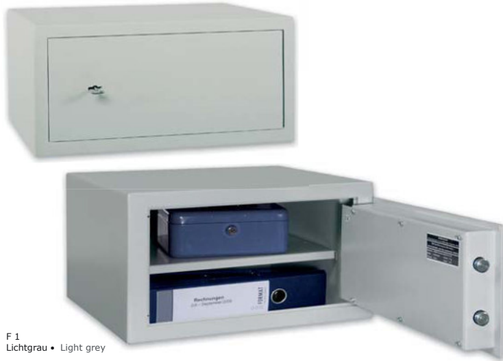
F 1 Lichtgrau • Light grey

Möbeleinsatztresor, Stufe A (VDMA 24 992, Ausgabe Mai 1995)* Furniture safe, Level A (VDMA 24 992, May 1995 edition)*