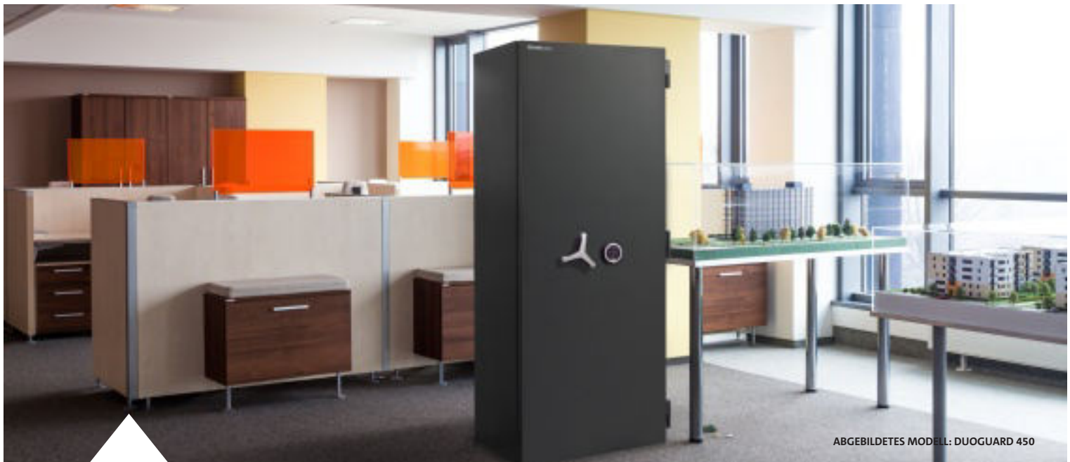
ABGEBILDETES MODELL: DUOGUARD 450